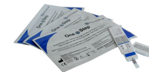
Fig.2 Test per droga singola con pannello