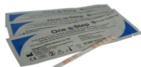
Fig.1 Test per droga singola con striscia