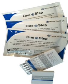
Fig.3 Test multi-droga con pannello

Per la natura sensibile di questo test per la droga, dovrete fare attenzione nell'eseguire il test per evitare contaminazioni, risultanti in risultati del test imprecisi. Si prega di leggere con attenzione queste istruzioni prima di iniziare il test.