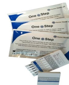
Fig.3 Test multi-droga con pannello

Per la natura sensibile di questo test per la droga, dovrete fare attenzione nell'eseguire il test per evitare contaminazioni, risultanti in risultati del test imprecisi. Si prega di leggere con attenzione queste istruzioni prima di iniziare il test.