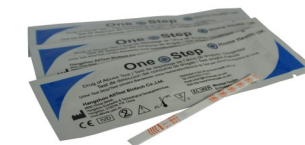
Fig.1 Test per droga singola con striscia