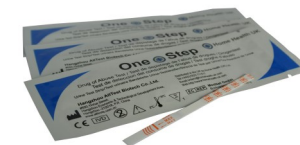
Fig.1 Test per droga singola con striscia