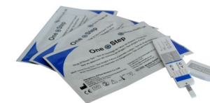
Fig.2 Test per droga singola con pannello