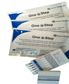
Fig.3 Test multi-droga con pannello

Per la natura sensibile di questo test per la droga, dovrete fare attenzione nell'eseguire il test per evitare contaminazioni, risultanti in risultati del test imprecisi. Si prega di leggere con attenzione queste istruzioni prima di iniziare il test.