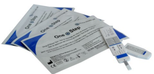
Fig.2 Test per droga singola con pannello