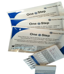
Fig.3 Panel de test pour plusieurs drogues

En raison de la nature délicate de ce test pour la drogue, vous devez être prudents lors de l'exécution du test pour éviter la contamination et donc un manque de précision dans les résultats du test. Veuillez lire attentivement ces instructions avant de commencer le test.