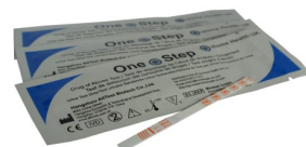
Fig.1 Bandelette test pour une drogue

L'une des substances les plus communes qui cause des faux positifs est la codéine, qui se trouve dans une variété de médicaments en vente libre contre la douleur. Ces produits donneront un résultat positif dans un test pour les opiacés / la morphine. Il serait souhaitable de demander aux personnes testées si elles prennent des médicaments aux fins médicales avant que le test soit effectué.