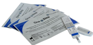
Fig.2 Panel de test pour une drogue