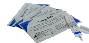
Fig.2 Panel de test pour une drogue