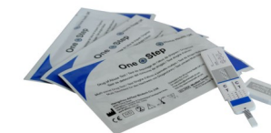
Fig.2 Panel de test pour une drogue