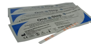
Fig.1 Bandelette test pour une drogue

Ce test est très précis et les niveaux de sensibilité sont conformes aux normes du SAMHSA (Substance Abuse and Mental Health Services Administration) aux USA, et aux niveaux recommandés fixés par le National Institute on Drug Abuse (NIDA). Il y a toutefois une possibilité de mauvais résultats dus à l'interférence d'autres substances dans l'urine. L'une des substances les plus communes qui cause des faux positifs est la codéine, qui se trouve dans une variété de médicaments en vente libre contre la douleur. Ces produits donneront un résultat positif dans un test pour les opiacés / la morphine. Il serait souhaitable de demander aux personnes testées si elles prennent des médicaments aux fins médicales avant que le test soit effectué.